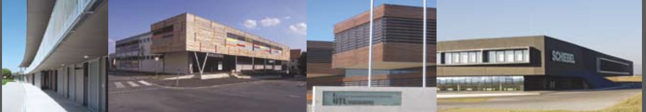
Weinlandbad RUNSER/PRANTL architekten