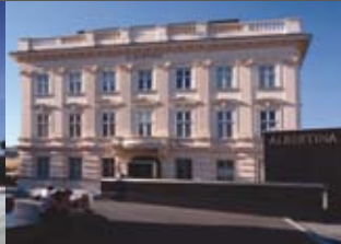
Albertina Architekten Steinmayr - Mascher & Partner