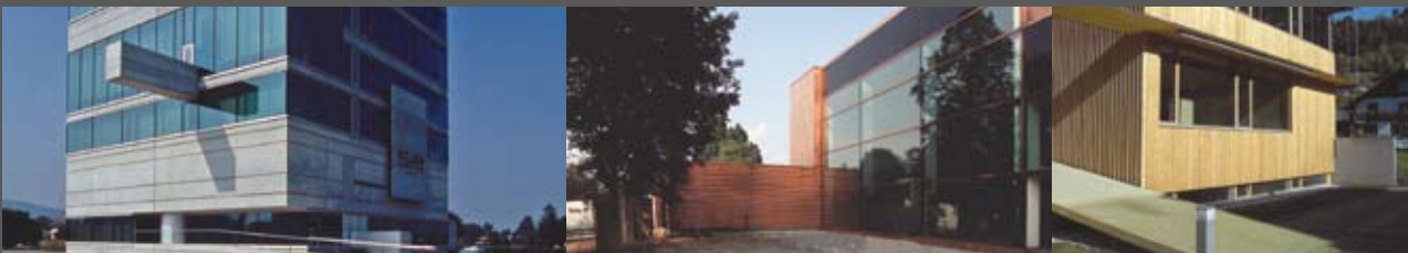
SIE Lustenau marte.marte architekten