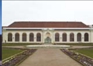
Orangerie Unteres Belvedere ARCHITEKTIN SUSANNE ZOTTL