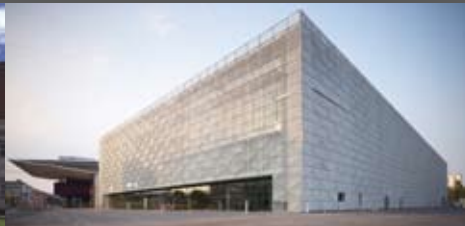
Messehalle Graz Riegler Riewe Architekten ZT Ges.m.b.H