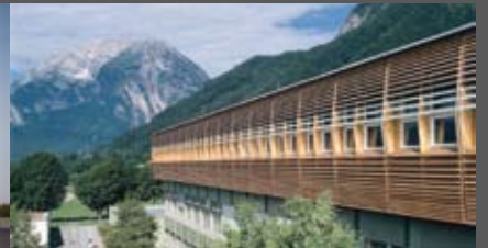
BG/BRG Stainach Bramberger[architects]