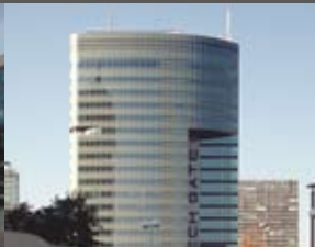
Techgate Tower Holzbauer und Partner Architekten