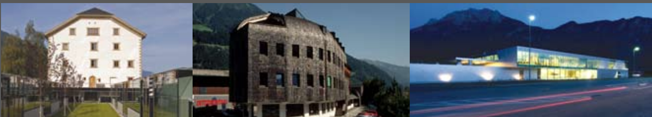
Mädcheninternat Stams querkopf.architektur