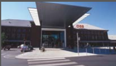
Bahnhof Klagenfurt ostertag architekten