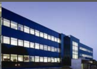
octapharma ECHERER + ECHERER Architekten ZT-GmbH