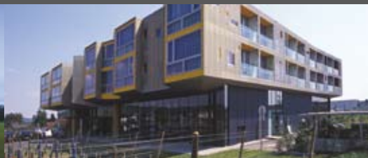
Hotel Loisium Langenlois Steven Holl und Sam/Reinisch-Ott Architekten