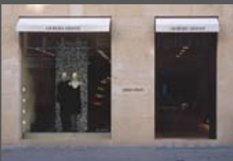
Armani Boutique Kohlmarkt Claudio Silvestrin architects