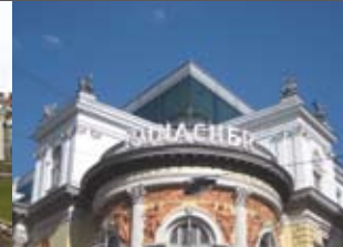
Theater Ronacher Architekten Domenig und Wallner