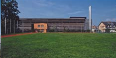
HTL Bregenz Baumschlager-Eberle Ziviltechniker GmbH