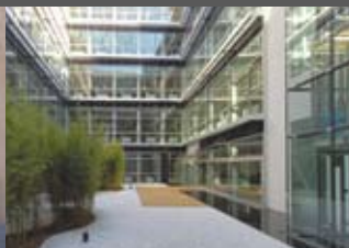
OSCE-Vienna ABLINGER, VEDRAL & PARTNER ZT GMBH