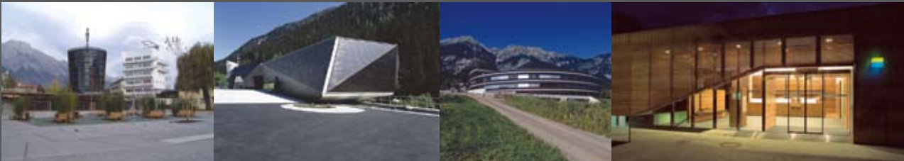
Stadtplatz Hall Auböck & Kárász