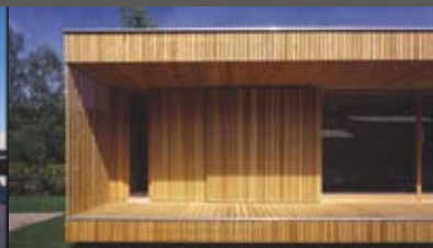
Seehaus Pörtschach LIMIT architects