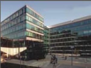
Statistik Austria Architekten Soyka/Silber/Soyka ZT GmbH