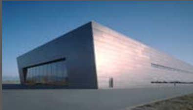
Alpa Werk Architekturbüro Alexander Früh