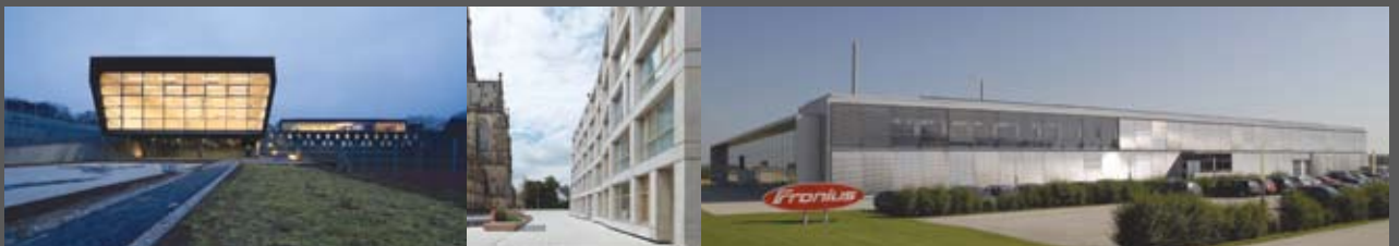
Sportpark Lißfeld sps-architekten zt gmbh