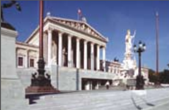
BZ im Österreichischen Parlament Geiswinkler & Geiswinkler Architekten