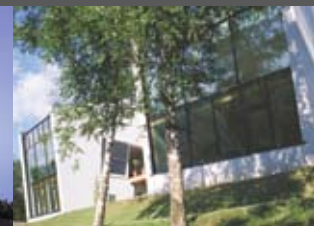
passivhäuser TOM und MA2 MAGK Architekten aichholzer I klein ZT OG