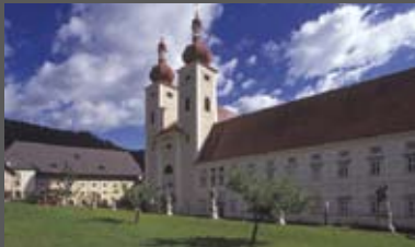
Seminarzentrum Benediktinerstift reitmayr architekten