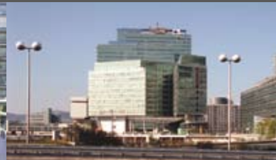
Strabag AG Hoffmann - Janz Ziviltechniker GmbH