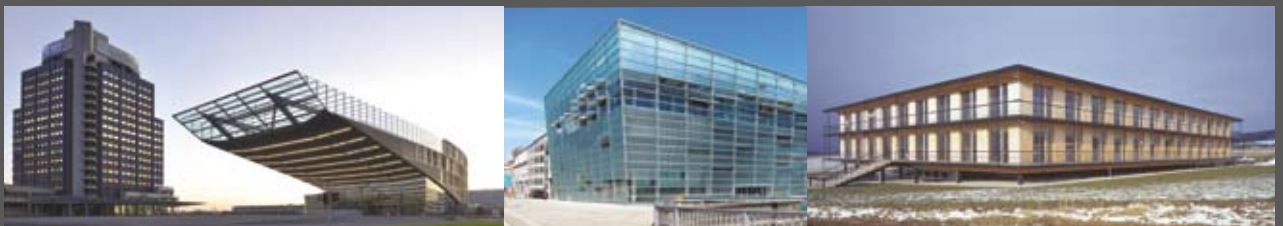
Verkaufs- u. Finanzzentrale voestalpine Stahl GmbH Dietmar Feichtinger Architectes