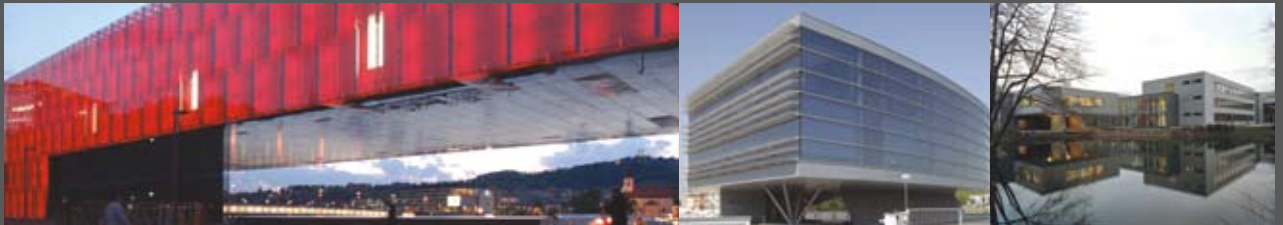
Kunstmuseum Lentos Linz Weber & Hofer AG