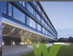
FH St. Pölten NMPB Architekten ZT GmbH