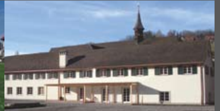
Kapuzinerkloster Feldkirch C4 Architektengemeinschaft Fohn+Sillaber